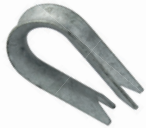
Sneaker of the strap