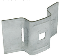
Suporte para BAP