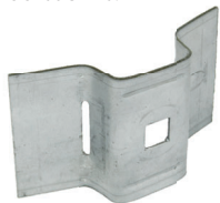
Support for BAP